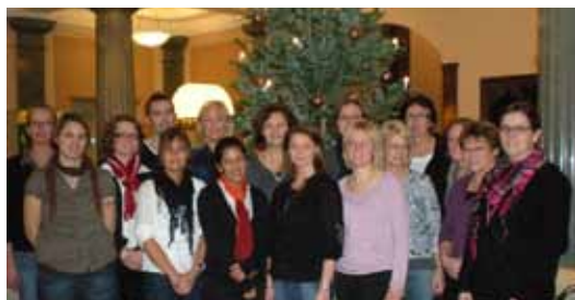
Deltagare från certifieringsutbildningen hösten 2008 i Göteborg