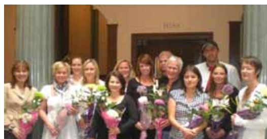
Deltagare från certifieringsutbildningen våren 2009 i Göteborg