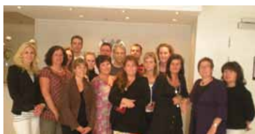
Deltagare från certifieringsutbildningen våren 2009 i Stockholm