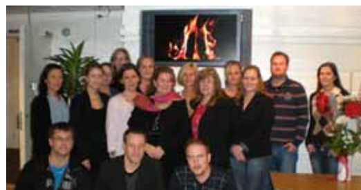
Deltagare från certifieringsutbildningen hösten 2008 i Stockholm