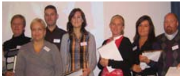
"Stolta deltagare som just erhållit diplom för avklarad certifieringsutbildning, hösten 07 och våren 08."