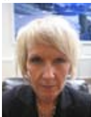
Text, Reporter på plats: Elisabet Hammar