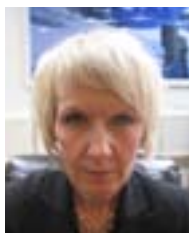
Text, Elisabet Hammar