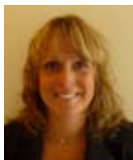
Text reporter på plats: Maria Nyrén Ivarsson

Ertsborn ansåg inte heller att ändringarna kommer att påverka kreditlivet i någon större omfattning. Han såg inte heller att ändringarna skulle påverka möjligheten till upptagande av kredit eller leda till höjda räntor.