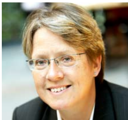
Eva Liedström Adler, Rikskronofogde

Vi har inte några invändningar mot vare sig beräkningen eller antalet. Inte heller vill vi på något sätt påstå att hushållens upplevelse av betalningsproblemen skulle vara felaktig eller överdriven. Men – som man frågar får man svar – och vare sig frågan eller definitionen säger något om vad räkningarna, amorteringarna och räntorna består av. Därmed kommer svaret att omfatta allt från basbehoven till trevliga, men inte livsnödvändiga utgifter.